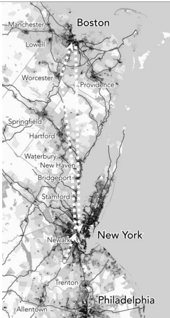
Рисунок 1. Маршрут основных известных нам перемещений А.Р. Лурия по восточному побережью Соединенных Штатов в ходе его заграничной поездки с 23 августа по 8-9 октября 1929 г.

После завершения психологического конгресса в Нью-Хейвене Лурия на некоторое время задержался в Америке и совершил целый ряд поездок по городам восточного побережья Америки 5 . Так, в ходе своей североамериканской поездки Лурия нанес визиты в целый ряд крупнейших исследовательских ведущих американских университетов, таких как Колумбийский (Columbia University, Нью-Йорк; последняя неделя августа), Йельский (Yale University, Нью-Хейвен; приблизительно с 1 по 10 сентября), Кларкский (Clark University,